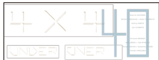
【2】 展覧会ビジュアル横長 (C) ADAN