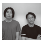
増田信吾 + 大坪克亘

大西は 1983 愛知県生まれ。2006 京都大学工学部建築学科卒業。2008 東京大学大学院建築学専攻修士課程修了。2011 同大学院博士課程単位取得退学。2011-13 横浜国立大学大学院 Y-GSA 設計助手。2013- 横浜国立大学、法政大学にて非常勤講師。百田は 1982 兵庫県生まれ。2006 京都大学工学部建築学科卒業。2008 同大学院修士課程修了。2009-14 伊東豊雄建築設計事務所。2008- 大西麻貴 + 百田有希 / o+h 共同主宰